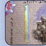
Figure metallic band under one angle of observation demonstrates rainbow holographic effect and under other angle turns silver with repeating denomination value: " 500 SP 500 ". Light text " 500 SP 500 " on the dark band is seen when note is exposed to transmitted light.

LOOK FACING LIGHT أنظر الى الورقة في مواجهة الضوء عند النظر الى الورقة بشكل عادي يظهر جزء من الشريط المعدني في وسط الورقة. عند النظر من إحدى الزوايا تظهر مؤثرات بصرية متعددة الألوان، ومن زاوية أخرى يتحول الشريط الى لون فضي مع كتابات متكررة لرقم الفئة: " 500 SP 500 ل.س.". عند النظر الى الورقة في مواجهة الضوء ، يظهر الشريط بلون اسود على طول الورقة مع كتابات بيضاء " 500 SP 500 ل.س.".