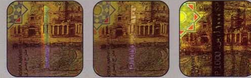
Figure metallic band under one angle of observation demonstrates rainbow holographic effect and under other angle turns silver with repeating denomination value: "SP1000 ل.س.". Light text "SP1000 ل.س." on the dark band is seen when note is exposed to transmitted light.

عند النظر الى الورقة بشكل عادي يظهر جزء من الشريط المعدني في وسط الورقة. عند النظر من إحدى الزوايا تظهر مؤثرات بصرية متعددة الألوان، ومن زاوية أخرى يتحوّل الشريط الى لون فضي مع كتابات متكررة لرقم الفئة: "SP1000 ل.س.". عند النظر الى الورقة في مواجهة الضوء، يظهر الشريط بلون اسود على طول الورقة مع كتابات بيضاء "SP1000 ل.س.".